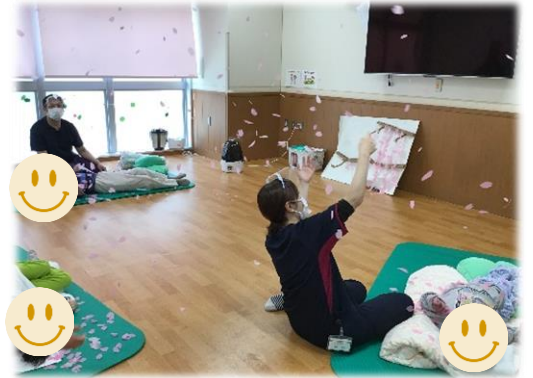
紙芝居・枝垂桜作り